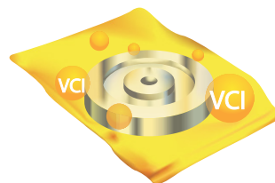
Ilustración de moléculas VCI encerradas en una bolsa VCI de ZERUST®.

A la izquierda: protección de aceite VCI de la competencia; a la derecha: Aceite VCI Axxanol™ 750 de ZERUST®. Resultados después de 24 horas en pruebas de niebla salina ASTM B117.