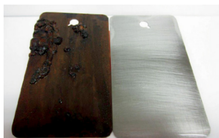
A la izquierda: sumergido en agua sin tratar (60 ppm Cl - , 300 ppm CaCO 3 ), a la derecha: sumergido en agua tratada con AxxaVis™ HST-10.

Axxatec™ 8110C es un aditivo a base de agua para la protección de espacios vacíos llenos de agua de equipos hidráulicos y de refrigeración.