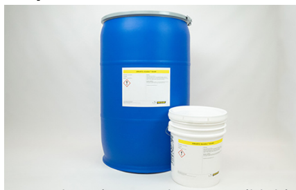
Protección de espacio vacío dirigida con inhibidores de corrosión ZERUST®.